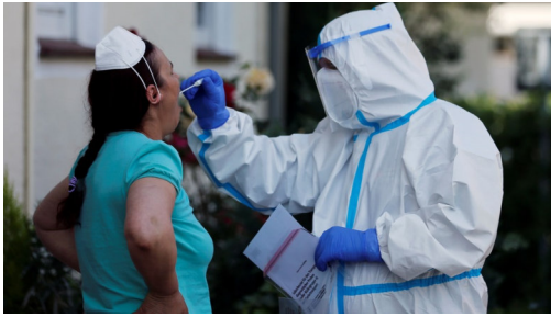
Video: Der zweite "Shutdown" und die wirtschaftlichen Folgen für den Kreis Gütersloh 05.07.2020

Die Entscheidung des Gerichts ist auch eine Niederlage für die Landesregierung - denn die nun kassierte Verordnung kam von ihr. Gesundheitsminister Karl-Josef Laumann (CDU) will davon aber nichts wissen. Er sagt: "Die aktuell in Gütersloh verordneten Maßnahmen waren Vorsichtsmaßnahmen, die solange gelten sollten, bis ein möglicher flächendeckender Eintrag in die Gesamtbevölkerung ausgeschlossen werden kann." Dies sei nun der Fall.