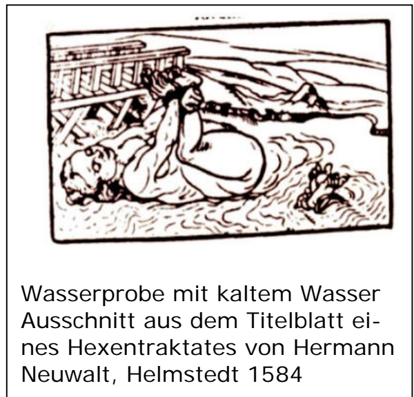
Wasserprobe mit kaltem Wasser Ausschnitt aus dem Titelblatt ei- nes Hexentraktates von Hermann Neuwalt, Helmstedt 1584